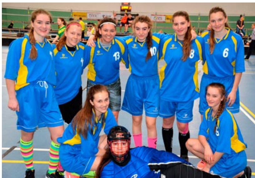
Florbalistky Gymnázia Jeseník - letos ve vynikající formě!