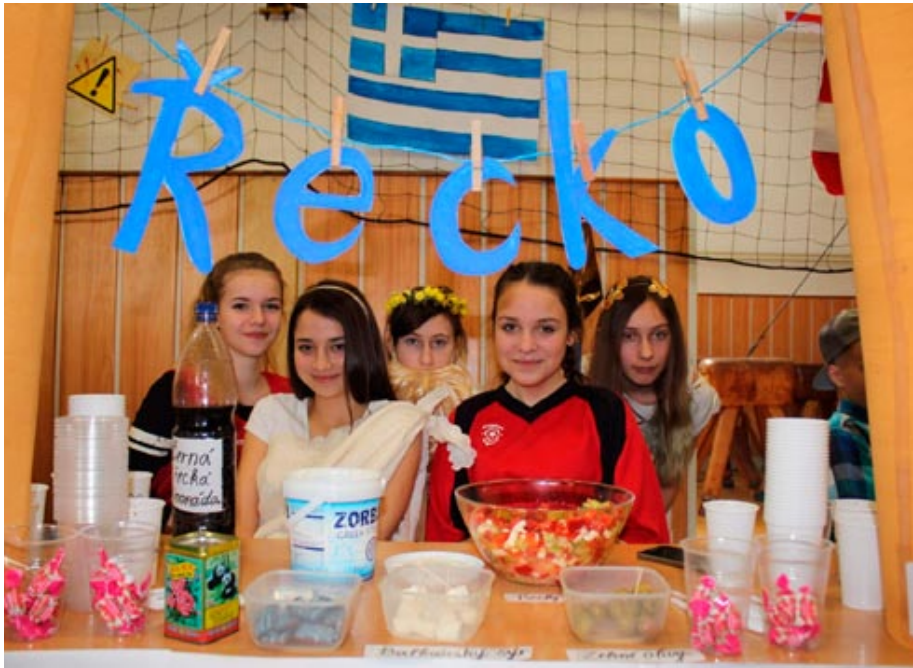
Ročníkový projekt třídy sekunda A s názvem Žijeme v Evropě byl opět korunován prezentací států.