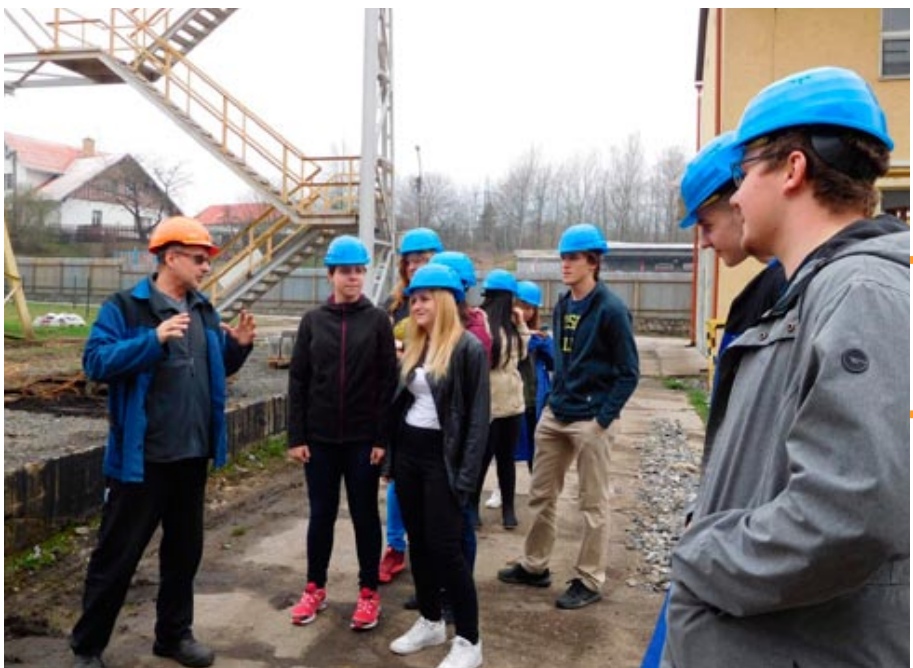
Studenti třetího ročníku byli na exkurzi v Řetězárně Česká Ves