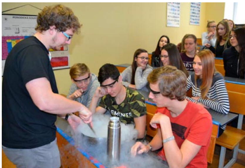
Výroba zmrzliny na Hodině moderní chemie s VŠCHT v Praze