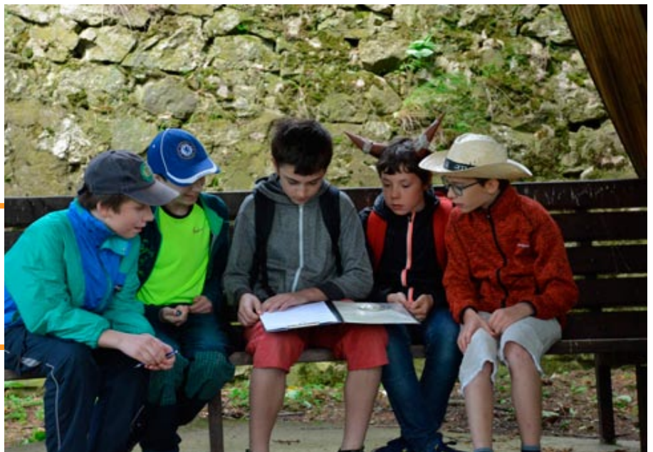
Primáni zakončili ročníkový projekt Poznej svůj region programem v Priessnitzových lázních.